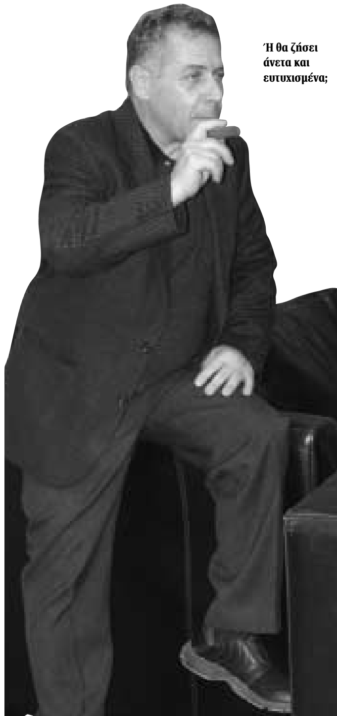
Ή θα ζήσει άνετα και ευτυχισμένα;